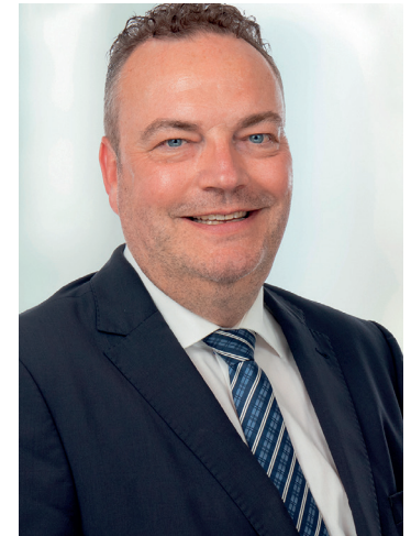
Bodo Klimpel Landrat

Dieser Wegweiser hilft Ihnen dabei, einen Überblick über die vielfältigen Hilfsangebote im Kreis Recklinghausen zu bekommen. Ich wünsche Ihnen ein gesundes, mobiles und zufriedenes Leben im Alter.