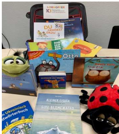
Der Lesekoffer enthält 13 mehrsprachige Bücher und 2 Handpuppen

Der KIKO Sprachzauber startete als Pilotprojekt und wurde zunächst an Flüchtlingsunterkünfte mit Kindertageseinrichtungen verliehen. Lesepatinnen unterstützten das Projekt vor Ort mit einer Lesestunde.